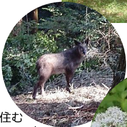
森に住む カモシカ