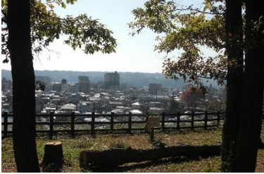
展望台からの景色